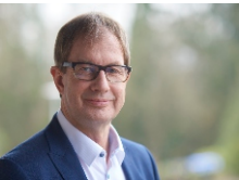
Schirmherr Bernd Hertzler Bürgermeister Stadt Blieskastel

19 Uhr in der Bliesgau-Festhalle , Einlass 18:00 Uhr „ARTEfix – die unendlichen Farben der Zeit“ Musical zu 35 Jahren Sommerakademie. Wegen der begrenzten Anzahl an Plätzen bitten wir um Anmeldung.